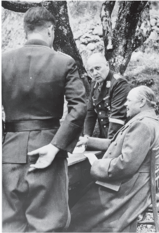
ALBERT KESSELRING SENTADO JUNTO A RICHARD HEIDRICH

Globos cautivos que flotaban sobre algunos de los navíos incrementaban esa sensación.